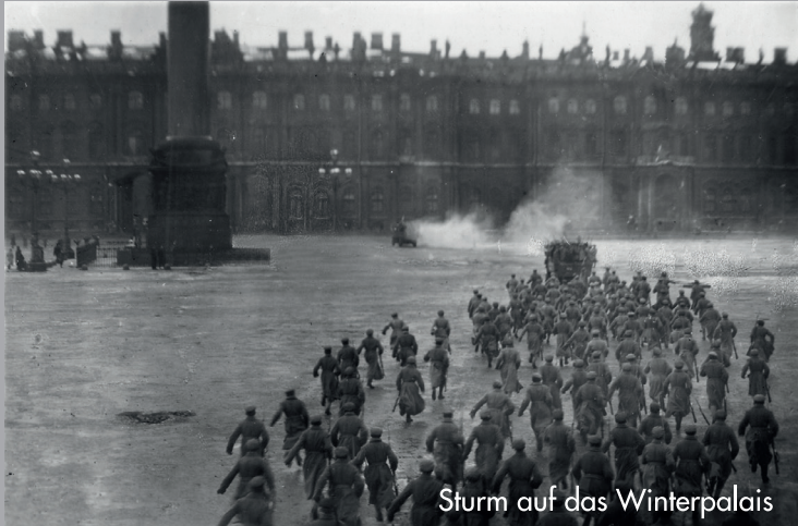
Sturm auf das Winterpalais

Für Teilnehmer aus Deutschland: Angebote für Flüge und Visum können Sie z.B. bei People-to-People Reisen anfragen: reisen@people-to-people.de Bitte schicken Sie in diesem Fall den Anmeldebogen zusätzlich an People to People!