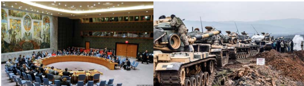
شورای امنیت سازمان ملل متحد

در عین حال، حاکمیت امریکا از دولت ترکیه دل‌جوئی می‌کند و به آن اطمینان می‌دهد. رکس تیلسون وزیر خارجه امریکا می‌گوید که واشنگتن مایل است برای برطرف کردن نگرانی‌های «مشروع» امنیتی ترکیه در شمال سوریه با این کشور همکاری کند. او گفت امریکا برای ایجاد ثبات پیشنهادهایی به ترکیه و سایرین ارائه کرده است.