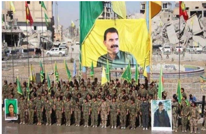
جشن آزادی رقه از کنترل داعش

اکنون داعش متلاشی شده است دولت ترکیه سخت از شکست داعش و پیروزی مهم نیروهای روژاوا هم خشمگین شد و هم نگران. چرا که اگر سیستم کنفدرالیسم دمکراتیک تثبیت شود تأثیر مستقیمی بر روی کردها و غیرکردهای خارومیانه، به ویژه ترکیه خواهد گذاشت از این‌رو، اردوخان به دنبال بهانه‌ای می‌گشت تا به روژاوا با هدف نابودی سیستم سیاسی آن حمله کند و ضربه کاری به نیروهای مدافع خلق وارد کند. از سوی دیگر، برای غرب و امریکا نیز آن همراهی نظامی با متلاشی شدن داعش عملاً به پایان رسیده بود. در چنین شرایطی، ناگهان یک ژنرال امریکایی اعلام کرد که ۳۰ هزار نیرو را در روژاوا آموزش خواهد داد. همین بهانه‌ای شد تا بلافاصله اردوخان فرمان حمله نظامی به عفرین را صادر نماید. در حالی که وزیر خارجه امریکا و کاخ سفید اعلام کردند که چنین تصمیمی ندارند. احتمالاً این ژنرال امریکایی با ژنرال‌های ترکیه، به این نتیجه رسیده بودند که این مسأله را مطرح کنند و زمینه را برای حمله نظامی ارتش ترکیه به عفرین مساعد سازند. وقایع بعدی نیز نشان داد که امریکا، روسیه، حکومت اسلامی و ناتو برای حمله به عفرین به دولت ترکیه چراغ سبز نشان داده بودند.