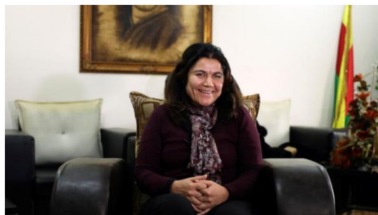
رئیس هیات اجرائی منطقه فدرال شمال سوریه

فوزه الیوسف، رئیس هیات اجرائی منطقه فدرال شمال سوریه، روز یکشنبه ۲۸ ژانویه ۲۰۱۸، اعلام کرد که نمایندگان خودگردان روزاوا در اعتراض به حملات مستمر ترکیه به عفرین، در نشست سوچی شرکت نخواهد کرد. به گزارش فرانس پرس، خانم فوزه الیوسف گفت: «پیش از این نیز گفته بودیم اگر اوضاع در عفرین به این شکل ادامه یابد، نمی‌توانیم در نشست سوچی حاضر شویم.»