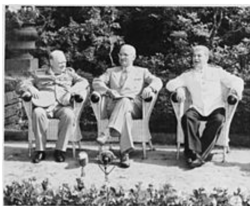
از چپ به راست: چرچیل، ترومن ، ستالین

این کنفرانس که در ماه جولای ۱۹۴۵ یعنی مقارن ختم جنگ جهانی صورت گرفت، در واقع بیشتر از آن که جهت حل مشکلات زمان جنگ دایر شده باشد، به نحوی تقدیر از پیروزی متفقین بر المان هیتلری بود. این کنفرانس از چند جهت با دو کنفرانس قبلی متفاوت بود. تفاوت اول در ترکیب کنفرانس بود، چه بعد از مرگ روزولت، ترومن به حیث جانشینش در کنفرانس شرکت نموده بود. تفاوت دوم این بود که در جریان کنفرانس به اساس انتخابات پارلمانی در انگلستان، حزب محافظه کار چرچیل اکثریت خود را از دست داده به جایش کلیمنت اتلی رقیب انتخابی اش پیروز شده، روز های آخر کنفرانس را بر هیأت نمایندگی انگلستان ریاست نمود. سومین نکته در قسمت جریان کنفرانس، استفاده از بمب اتمی توسط امریکا علیه جاپان بود که مسؤولیت صدور فرمان انجام آن را شخص ترومن از همانجا صادر نمود.