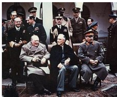
از چپ به راست: چرچیل، روزولت، ستالین

این کنفرانس که در حقیقت دومین کنفرانس بین سران قدرت های پیروزمند آنروز جهان در کریمیه یا یالتا از چهارم الی یازدهم فبروری ۱۹۴۵ دایر شده بود، زمانی بود که ارتش پیروزمند اتحاد جماهیر شوروی آنروز حدود ۶۵ کیلومتر از برلین فاصله داشت. کنفرانس از آغاز الی انجام آن به نحوی تحت تأثیر جذبه و نفوذ معنوی ستالین و توانمندی ارتش سرخ قرار داشت. در این کنفرانس تقریباً راجع به سرنوشت تمام کشور های اروپای شرقی و آینده آنها من جمله قسمتی از شرق پولند و آینده المان بعد از نابودی کامل المان هیتلری صحبت به عمل آمد.