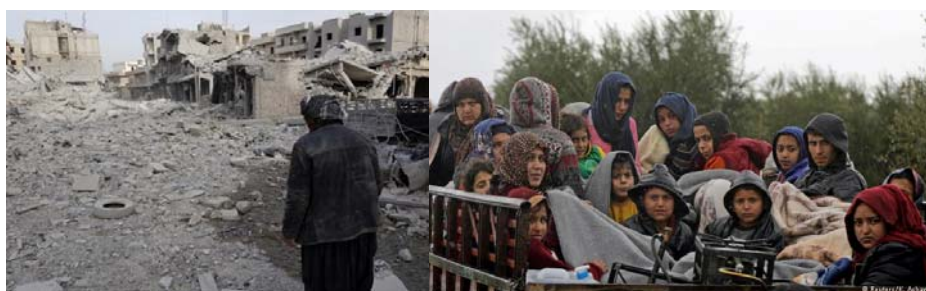
بسیاری از ساکنان عفرین برای نجات جان خود ناچار به گریز از شهر شده‌اند

دولت ترکیه پس از کودتای نافرجام بازداشت‌ها و پاکسازی‌های گسترده‌ای را آغاز کرد که با انتقادهای شدید داخلی و بین‌المللی روبرو شد. انجمن روزنامه‌نگاران ترکیه می‌گوید پس از کودتای نافرجام حدود ۱۳۰ رسانه در این کشور تعطیل و نزدیک به ۱۶۰ روزنامه‌نگار بازداشت شده‌اند که تعداد زیادی از آن‌ها هنوز در زندان به سر می‌برند. دولت ترکیه تا کنون به حکم دادگاه حقوق بشر اروپا واکنشی نشان نداده است. مطابق گزارش‌های کمیته محافظت از روزنامه‌نگاران، ترکیه در سال ۲۰۱۷ برای دومین سال پیاپی با ۷۳ روزنامه‌نگار بازداشتی بزرگترین زندان روزنامه‌نگاران در جهان بوده است.