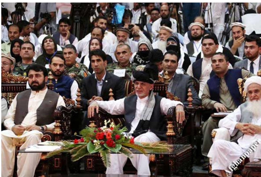
موشی که خود را شیر می پندارد

جمعه- ۱۵ سرطان ۱۳۹۷ - کابل: می گویند بعضی وقتها، یک عکس و یا یک تصویر بیشتر از ده ها صفحه مطلب را در خود انعکاس می دهد، اگر باور ندارید به این چند عکس که در جریان مسافرت اخیر "غنی احمدزی" جاسوس و وطنفروش بی آرم گرفته شده دقت نمایند: