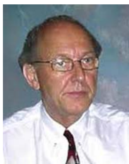
پروفسور میشل چوسودوفسکی

نویسنده: پروفسور میشل چوسودوفسکی برگردان از: آمادور نویدی ۲۲ اگست ۲۰۱۸