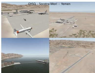
باند و میدان هوائی موجود

«درمیان برنامه های جدید، صالح و پترائوس توافق کردند که از هواپیماهای جنگی، شاید هم پهپاد ها و موشک‌های دریابرد امریکائی استفاده شود. طبق گفته یک مقام ارشد یمنی که درباره موضوعات حساس صحبت می‌کرد و (تقاضا کرد تازمانی که عملیات پیش‌تر توسط یمنی ها تصویب شود)، ناشناس بماند. مقامات امریکائی می‌گویند که جزیره سوکوترا، ۲۰۰ مایلی ساحل یمن، از یک باند فرودگاه کوچک گرفته [تحت ریاست نظامی یمن] تا یک پایگاه هوائی کامل تقویت می‌شود تا بتواند به برنامه های کمکی پیش‌تری، همچنین در مبارزه علیه دزدان دریائی کمک کند. پترائوس همچنین تلاش می‌کند که به نیروهای یمنی تجهیزات اساسی مانند زره پوش های هام وی و احتمالاً هلیکوپترهای پیش‌تری ارائه دهد.» (نیوزویک، ۱۸ جنوری، ۲۰۱۰، تأکید از نویسنده است).