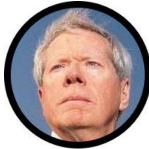
پل کریگ رابرتز

نویسنده: پل کریگ رابرتز ارسالی: مجله هفته ۲۹ اکتوبر ۲۰۱۸