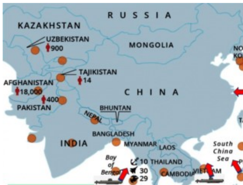
Mapa: Los puntos son bases militares. Las flechas son misiles de alcance.

According to a report of the United States Congress , This country has undertaken up to 251 military interventions since 1991. The United States has spread all over the world more from 800 military bases and nearly 5,000 Defence sites. Respect With China, Washington is increasingly heading towards a Cold War. Over the years it has Gone creating A real siege military (2) and has established military partnerships with Countries of the region (3) for isolating China: the Quadrilateral, AUKUS, the Five eyes.