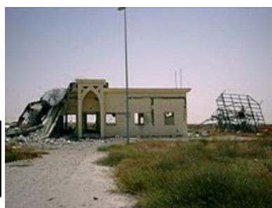
بخش آسیب دیده فرودگاه غزه، می ۲۰۰۲