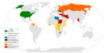
کشورهایی که به اشکال مختلف مورد تحریم امریکا واقع شده‌اند

بعد از پیروزی انقلاب ۵۷ و سقوط حکومت غربگرای پهلوی، دولت جمهوری اسلامی با مخالفت پیاپی نسبت به خواسته‌های طمع‌ورزانه آمریکا همواره تلاش کرده است تا در عرصه‌های اقتصادی، نظامی و... ایران را به خودکفائی برساند. اما آمریکا با اعمال سلسله تحریم‌های مالی، تولیدی و نظامی بر کشورمان موفق گشته که میزان تولید نفت و علاوه بر آن، صادراتش را به بازارهای جهانی بسیار کاهش دهد و علاوه بر آن، با ایجاد طرح فروپاشی ریال ایران که از سال ۱۳۹۱ با پشتیبانی فکری جیمز ریکاردز، مشاور مالی دولت امریکا، بلانی بر سر ارزش پول ایران آورده که در طی یک دهه گذشته قیمت دالر از ۱۶۰۰ تومان به ۲۶۵۰۰ تومان رسیده است و منجر به ایجاد تورم بیش از ۴۰ درصدی بر شانه‌های نحیف زحمتکشان ایرانی گردیده و بیش از ۱۰ میلیون نفر ایرانی طی یک دهه گذشته به جمع اقشار فقیر پیوسته‌اند.