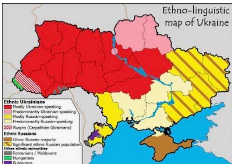
نقشه ی بومی و زبان شناسی اوکراین

نیروهای غیر دولتی خواهند افتاد . پس از دوماه، این دلتک سیاسی توانسته صدها میلیون دالر پول را به اهداف نامشخصی بفرستد . این در حالی است که ملت اوکراین در گرسنگی و بیماری و ناامنی دست و پنجه نرم می کند. ستراتیژی ایالات متحده برای تشکیل مرکزیت در جهان تنها با وجود گسترش جنگ به سمت غرب خواهد بود . که جنگ در ترانسسینیستری [5] مقصود اصلی نمی باشد بلکه فروپاشی اقتصادی اتحادیه اروپا مد نظر است. تا به امروز دولتهای پولند و بلغارستان حاضر نشدند پول گاز را با روبل روسیه بپردازند و به این جهت از وجود گاز محروم شدند . سایر اعضای اتحادیه اروپا حاضر شدند پول گاز را به روبل بپردازند اما نه به صورت مستقیم به شرکت گاز پروم بلکه به واسطه عملیات بانکی . کشور پولند مدعی دریافت گاز از کشور دیگری است اما وارسا تنها قادر است گاز روسیه را از کشور اروپائی دیگری وارد کند که آنها نیز با روبل روسی وارد بازار خرید گاز شده اند . تنها تفاوت در این معامله نیاز به معرفی واسطه به وجود می آید. کشورهای اروپایی با پیروی از سرور خود -ایالات متحده- باید منتظر کاهش گسترده سطح زندگی خود باشند و تمام جواهرات خانوادگی خود را از دست بدهند . اما کسی متوجه این موضوع نمی باشد.