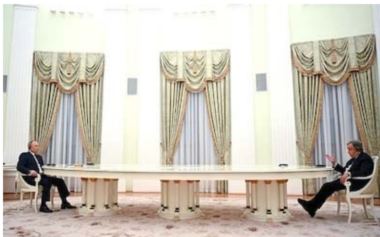
ولادیمیر پوتین و آنتونیو گوترش

در واقع تا کنون مردمان اوکراین تنها مسیرهای خروجی به سمت مولداوی و پولند را درخواست کردند ، در حالی که مردمان روسی این منطقه خواستار مسیرهای خروجی به سمت بلاروس و روسیه بودند (چرا که می دانستند گروه های باندریست آنها را دستگیر و محاکمه خواهند کرد ) . اما تا کنون هیچ توافقی در این زمینه صورت نگرفته . در ارتباط با کارخانه آزوآستال ماریوپول ، کسی نمی داند آیا مردمان غیر نظامی در آنجا حضور دارند یا خیر . ارتش روسیه راه خروجی ایجاد کرده که در این رابطه هزار و سیصد سرباز اوکراینی تسلیم شده اند ، اما از وجود مردمان غیر نظامی اطلاعی در دست نمی باشد . زندانیان جنگ اوکراین مدعی شدند مردمان غیر نظامی به صورت سپر انسانی از سوی گروه های باندریست بهره برداری می شوند . یکی از شخصیت های ترک که پیرو همکاری با چین-روسیه و ایالات متحده می باشد ( دوغو پنیچک) مدعی شده ۵۰ افسر فرانسوی در داخل کارخانه می باشند [6] . روسیه از ملل متحد خواسته تا برای بررسی وضعیت هزار و سیصد زندانی اوکراینی ، نیرو گسیل دارد . مسکو قصد دارد خواسته های بشر دوستانه خود را نشان دهد و بتواند سربازان اسیر خود را در اوکراین آزاد کند . چرا که ویدیو ها و عکس های فراوانی وجود دارد که سربازان اسیر روسی در آن شکنجه می شوند .