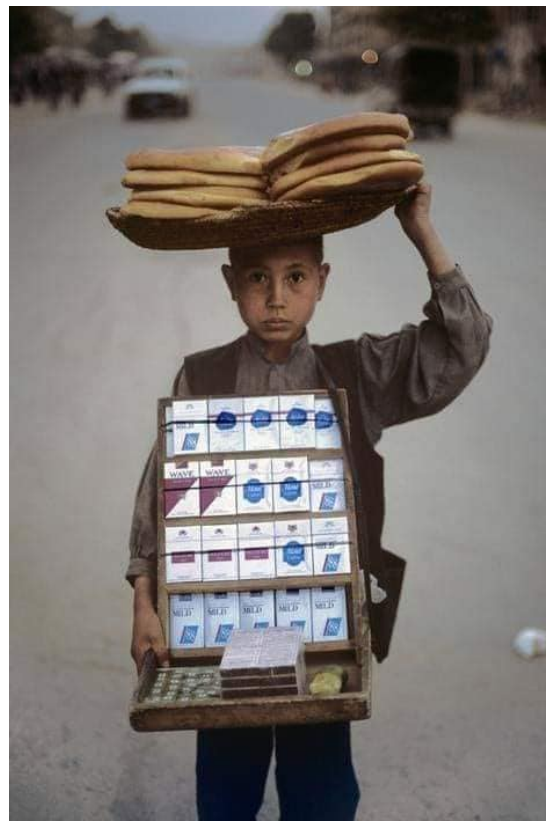
آه بر سینه و نان بر سر و در بازارم