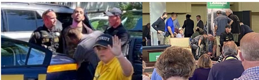
ضارب سلمان رشدی در میان مامورین امنیتی

سلمان رشدی کمتر از دو ماه پیش در حالی ۷۵ ساله شد که بیش از سه دهه اخیر را زیر سایه حکم قتل زندگی کرده است که توسط روح‌الله خمینی، بنیان‌گذار و رهبر حکومت جهل و جنایت و ترور اسلامی، صادر شد. خمینی در فتوای خود فقط سلمان رشدی را به مرگ محکوم نکرده بود، بلکه خواستار قتل همه «ناشرین مطلع از محتوای» رمان «آیات شیطانی» نیز شد و از «مسلمانان غیور» خواست «در هر نقطه که آنان را یافتند، سریعاً آنها را اعدام» کنند. بنیان‌گذار حکومت اسلامی چند ماه پس از صدور این فتوا درگذشت، اما فتوای او به قوت خود باقی ماند و حتی مبلغ نمادین پاداشی که برای عمل به آن در نظر گرفته شد، افزایش یافت. گزارش‌ها حاکی است که حکومت اسلامی برای کسی که نویسنده «آیات شیطانی» را به قتل برساند، بیش از «سه میلیون دلار» پاداش در نظر گرفته است. رشدی ۷۵ ساله از سال ۲۰۰۰ در امریکا زندگی می‌کند و در سال ۲۰۱۵ عنوان «نویسنده برگزیده» از دانشگاه نیویورک را دریافت کرد.