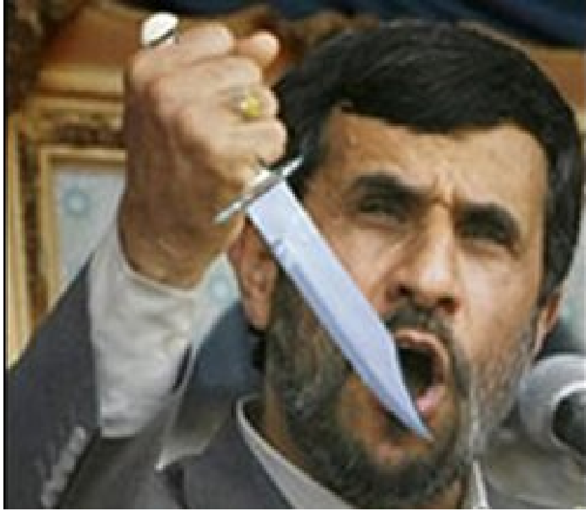
[از چاقو کشی تا ریاست جمهوری]