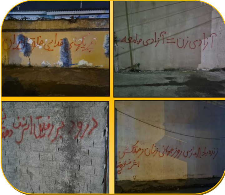
شعارنویسی در آستانه ۸ مارس، روز جهانی زن در یکی از شهرهای ایران

... واقعیت این است که امپریالیسم دشمن اصلی مردم فلسطین بوده و مبارزه مردم فلسطین برای رسیدن به آزادی قبل از هر چیز مبارزه‌ای ضد امپریالیستی است و به همین دلیل هم رهائی این خلق ستمدیده بدون قطع قطعی سلطه و نفوذ امپریالیسم امکان پذیر نمی‌باشد. نغی و نادیده گرفتن این واقعیت و توهم رسیدن به صلح و آزادی از طریق الطاف امپریالیست‌ها و در چارچوب طرح‌های امپریالیستی - که قدمت آنها به قدمت جنبش انقلابی توده‌های فلسطینی باز می‌گردد - نتیجه‌ای جز آن چه هر روز با آن مواجهیم ندارد. چنین توهماتی تا کنون باعث شده است که به ظاهر راه حل‌هایی که جهت "حل" معضل اسرائیل و خلق فلسطین عرضه می‌شوند، هر بار با شکست مفتضحانه‌ای روبرو شوند و بر ابعاد مشکلات و رنج‌های توده‌های تحت ستم فلسطینی اضافه گردد... در صفحه ۲