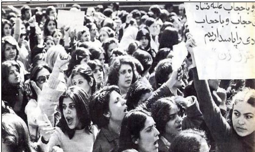
تظاهرات زنان آزاده علیه قانون حجاب اجباری در اسفند ۱۳۵۷

از انقلاب و بیان‌کننده خواسته‌های واقعی انقلابیون نیست؛ بلکه نتیجه‌ی سوءاستفاده دشمن از واقعیات درون جامعه و از ریخت انداختن خواسته‌های واقعی انقلابیون توسط دشمن است. درواقع دشمن همیشه تلاش میکند که شعارهای انقلابی و کاری مردم را معیوب