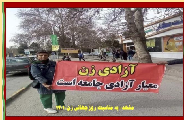
شاهد - به مناسبت روز جهانی زن ۱۴۰۱