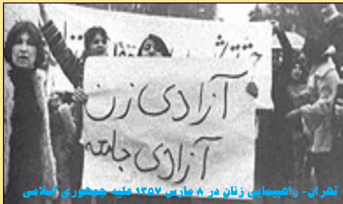
تهران - راهپیمایی زنان در ۸ مارس ۱۳۵۷ علیه جمهوری اسلامی

و واضحی ندارد؛ ناگهان بردند روی آنتن و رسانه ای شد؟ چرا هیچکدام از آن همه شعارهای مشخصی که مردم در جنبش؛ برای تحقق خواسته های طبقاتی خود سر دادند؛ در رسانه های جهانی مطرح نشدند؛ اما امپریالیستها آن همه تبلیغات صرف آن شعار مبهم کردند؟