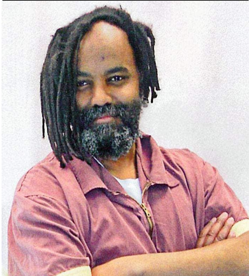
مومیا ابوجمال (امریکایی)، د ۱۹۹۴ کال دسمبر

بگذریم از اینکه سطح کارگران بیکار بیش از پیش افزایش یافته است و این خود سطح استثمار طبقه کارگر را بالا برده است. در حال حاضر کارگران کشور ما، ارزان ترین نیروی کار در کشورهای منطقه به شمار می رود.