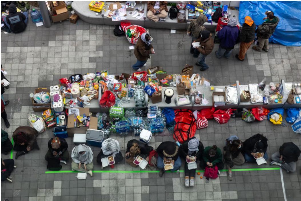
جیسون آلپرت-ویسینیا | واشنگتن اسکوائر نیوز، دانشگاه نیویورک

در این عکس، دانشجویان در حال خوردن غذاهای اهدائی و خریداری شده بودند. آن‌ها غذای خود را در مرکز اردوگاه چیده بودند و دور از چادرهای خود در آنجا نشسته و غذا می‌خوردند. من می‌خواستم سکوت را نشان دهم، در بین لحظات عمل که همه‌جا وجود دارد. عکس‌برداری از بالا میزان اعتراضات دانشگاهی را نشان می‌دهد. من این عکس را از طبقه سوم مرکز پلسون دانشگاه نیویورک گرفتم