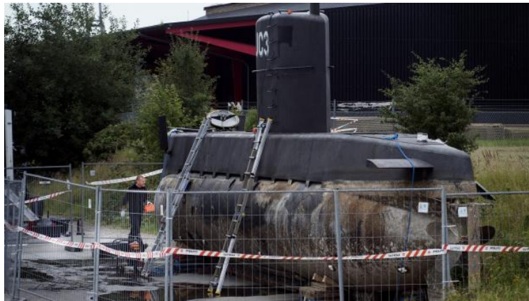
زیردریایی از قعر دریا بیرون کشیده شد

پولیس دنمارک طی بیانیه‌ای اعلام کرد که پیتر مادسن متهم به قتل غیر عمد در اثر سهل‌انگاری است. او به پولیس گفته که در نتیجه حادثه‌ای که درون زیردریایی رخ داد، کیم وول فوت شده و او نیز جسدش را در مکان نامعلومی در نزدیکی سواحل جنوبی کپنهاگ به آب انداخته است. او هیچ توضیحی درباره حادثه‌ای که منجر به فوت این روزنامه‌نگار جوان شد، نداد.