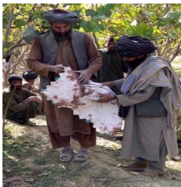
د کلي بي چاره خلک، رسنيو ته د بي رحمه بمبارۍ نتيجه ښايي.