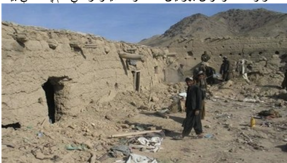
شنونکي په دې باور دي چي داسي پېښي ډېرې شوي او کبزي، خو ډېرې کمې رسنيو ته رسي. داسي ډېرو هېوادوالو خپل ژوند او شتمني له لاسه ورکړي ده، خو رسنيو ته هر چا لاس رسي نه دی لرلی.