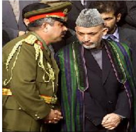
پښتون دښمن کرزی له نمک حرام دوستم سره

کوچیانو له حق څخه سترګې پټوي او هر کال یې له بهسودو څخه په سره گرمي کې له خپلو مېنو څخه شري تر څو جنګي جنایتکاران خوښ وساتي او په ټولټاکنو کې ناوره معاملې ورسره وکړي .