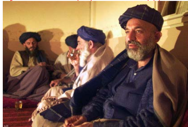
دکرزي رښتینی تصویر کوم چې دښمن دکنفرانس په ورځو شپو کې اخیستل شوی

کرزی دکریکټ اتلان ځکه نه نازوي چې هغوی دافغانستان اصلي توکم (پښتانه) دي خوکرزی اوس بدل شوی دی خلک خو لا داسې هم وايي چې په دا لاندې تصویرونو کې یو اصلي کرزی دی چې اوس وجود نه لري خو دا بل کاپي کرزی دی چې په هره ژبه لگیا او په خپل ځان حاکمیت نه لري .