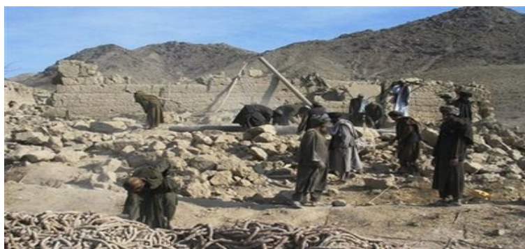
ولس لا لگيا دی او د ورکو خلکو پسي د ويجارو کورونو په وړانۍ کي گرځي.